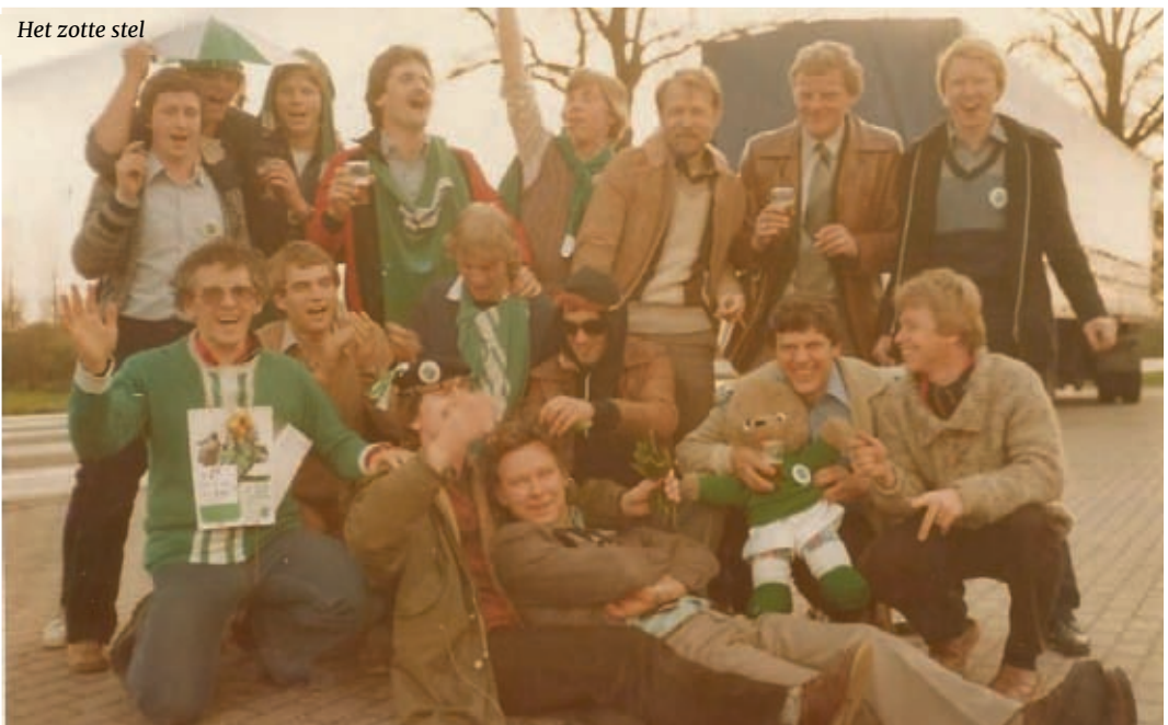
Het zotte stel