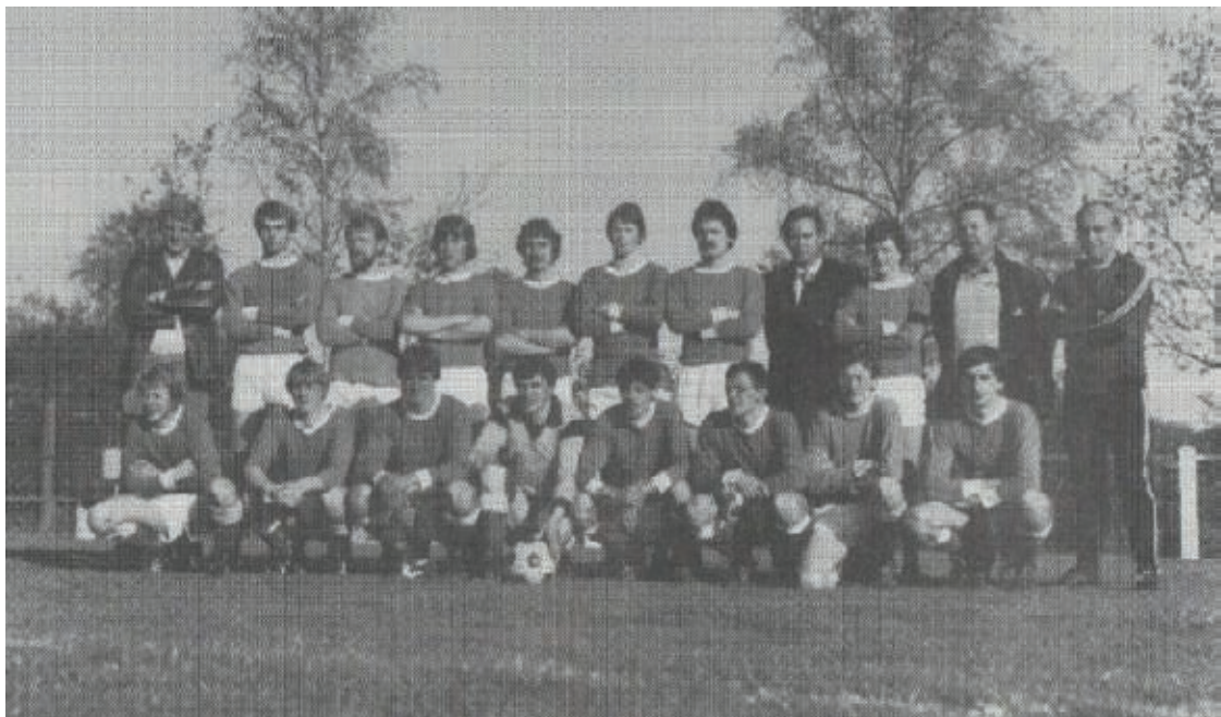
Het tweede elftal kampioen in het seizoen 1979-'80.