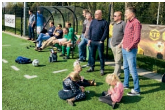
HVV Tubantia 2-FC Berghuizen 2; naast de twaalf man op de bank, in en naast de dug-out stonden er ook nog eens elf in het veld!

Waterflessen die al door dorstige wissels zijn leeggedronken voordat ze de mond van een speler hebben kunnen bereiken. Tasjes met waardevolle spullen die in dug-out blijven liggen, terwijl iedereen lekker in de kleedkamer in de rust aan de thee zit. 'Ligt toch een trainingsjasje overheen.'