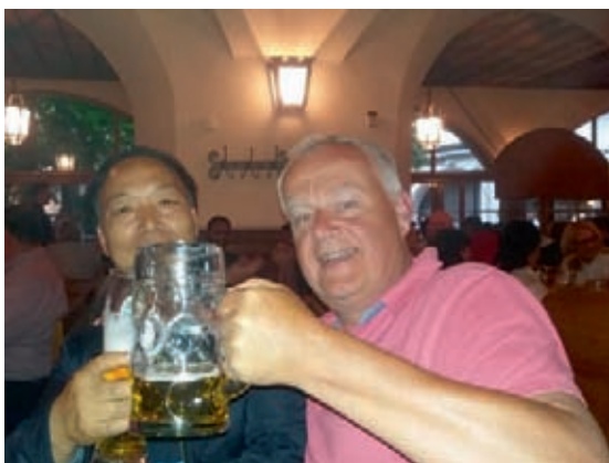
Proosten en genieten tijdens de Bierfeesten in Bayern.