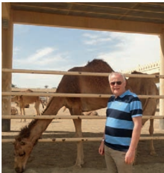
‘Nu ik vrijer ben geniet ik volop.’

“Toen ik 62 was. Ik had plezier in mijn werk, maar er is meer. Werk slokt heel veel tijd op. Nu ik vrijer ben geniet ik volop. Maar ik ben nog zeer actief. Natuurlijk bij FC Berghuizen en pas weer met de St. Nicolaasactie. Dat blijft ook, want dat is een geweldige actie. Verder zit ik in de werkgroep Maria Noaberschap van de kerk, die kijkt naar de toekomst van de geloofsgemeenschap en de kerklocatie, rijd ik op het busje van het verpleeghuis Gereia, maak ik namens FC Berghuizen en de geloofsgemeenschap deel uit van het bestuur van Kansrijk Berghuizen, help ik één keer per week mee aan de bouw van de praalwagen van De Spanvöggel en ben ik penningmeester van de Midvastenloop.”